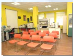
Centro Servizi Multimediale